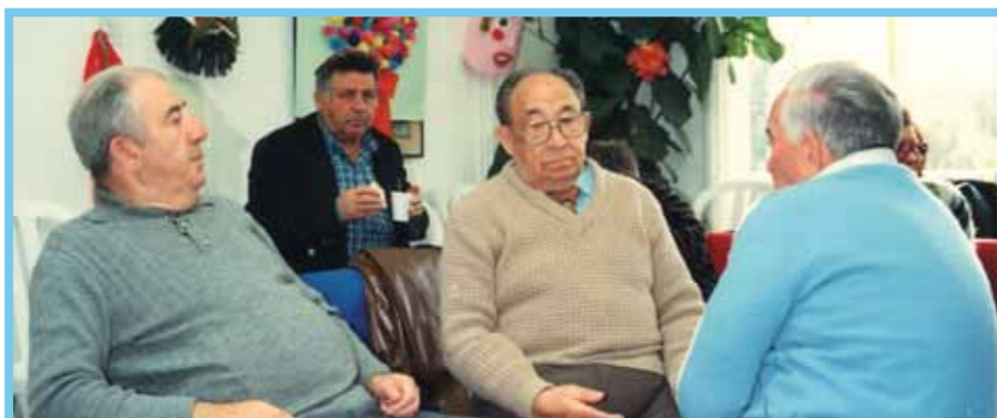
Ouderen bij een bijeenkomst van Amcha voor traumaverwerking.

"Wat ik zelf iedere keer nog het meest aangrijpend vind, zijn de trauma's waarmee de mensen worstelen. Dat snijdt